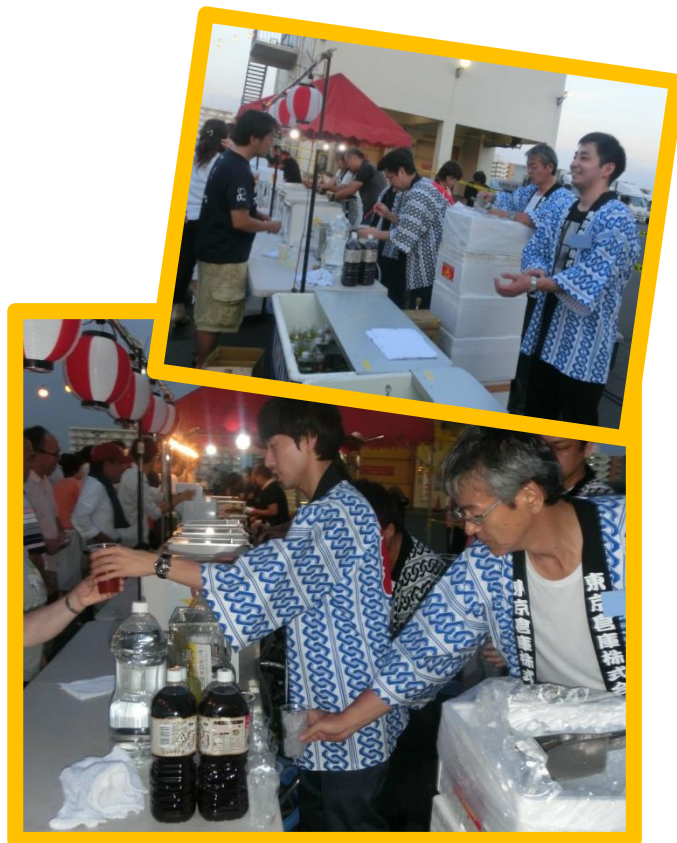
当社社員がはっぴ姿でおもてなし