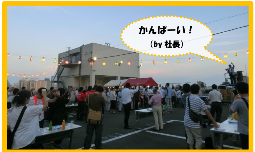
当社社長の乾杯音頭で開会